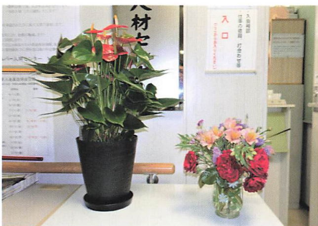
玄関で出迎える季節の花

公益社団法人 郡山市シルバー人材センター 〒963-8024 福島県郡山市朝日一丁目29番9号 T E L (024)933-0001 F A X (024)933-0019 URL http://www.k-sjc.org 発行：広報委員会