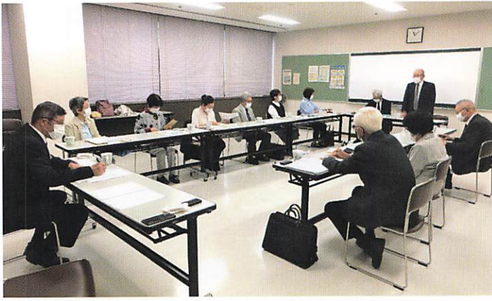
定例理事会の様子