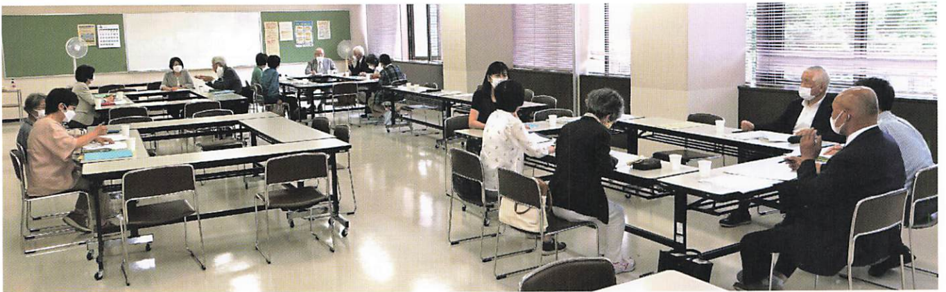
委員会会議の様子