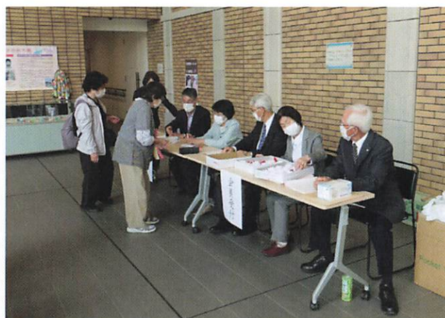
定時総会会場受付の様子