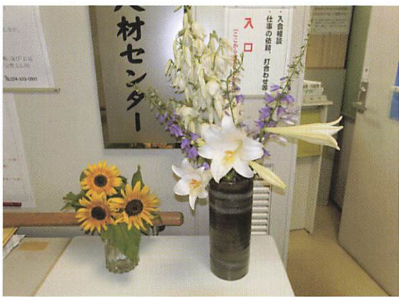
センター玄関を彩る花々