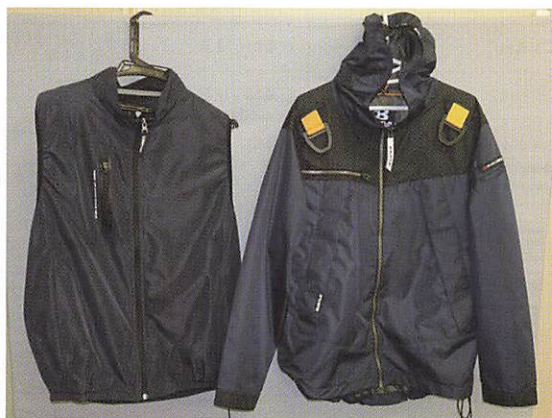
空調服 (ベスト、ジャンパー)