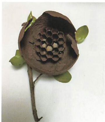
花と見紛う蜂の巣

共助会では、コロナ禍に負けず、今年度こそ会員のみなさま方に、楽しい企画を発信して参りたいと考えています。