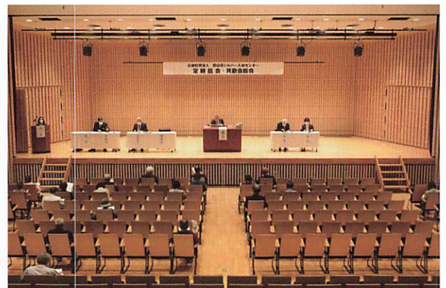
(定時総会・共助会総会の様子)