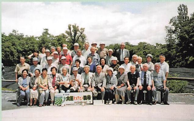
(2001-6-20 共助会旅行 長野松本城と信濃)