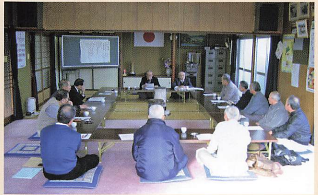
(2007-1-21 地区班会議 東1班)