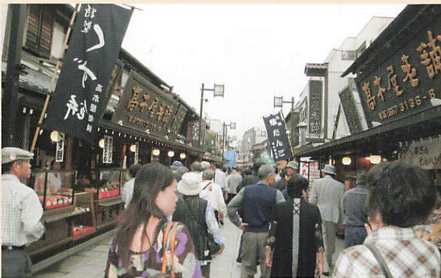
(2010-10-4 共助会旅行 東京築地・浅草・柴又帝釈天)