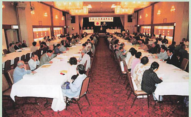
(2002-5-28 通常総会 エミナルあさひ)