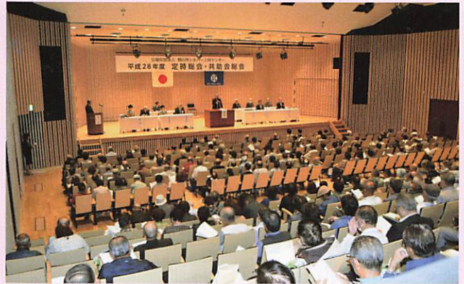
(2016-5-29 定時総会 郡山市中央公民館多目的ホール)