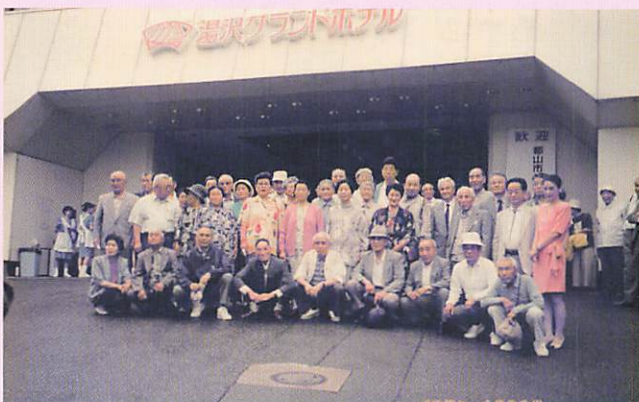
(1997-6-20 会員旅行 越後路と湯沢温泉)