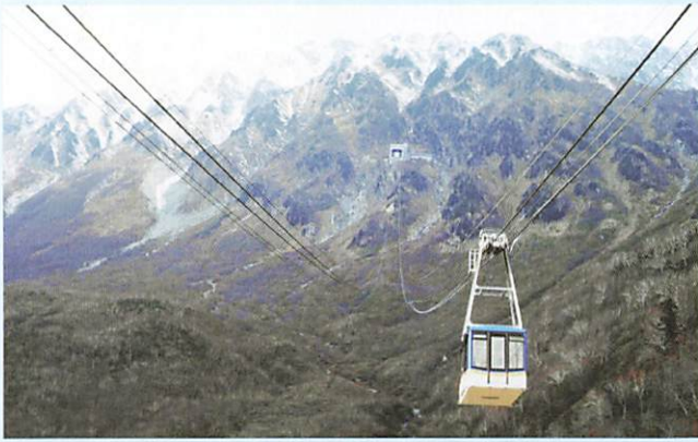
(2013-10-29 共助会旅行 黒部立山)