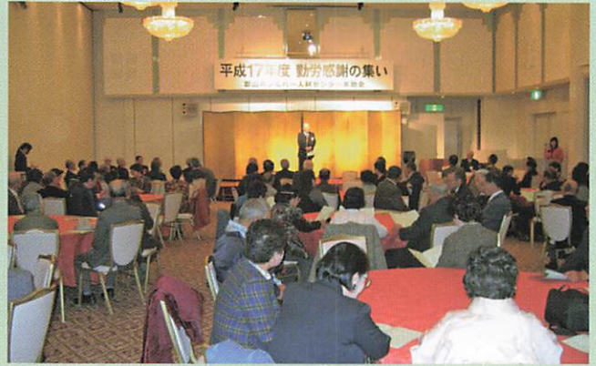
(2005-11-18 勤労感謝の集い 郡山ビューホテルアネックス)