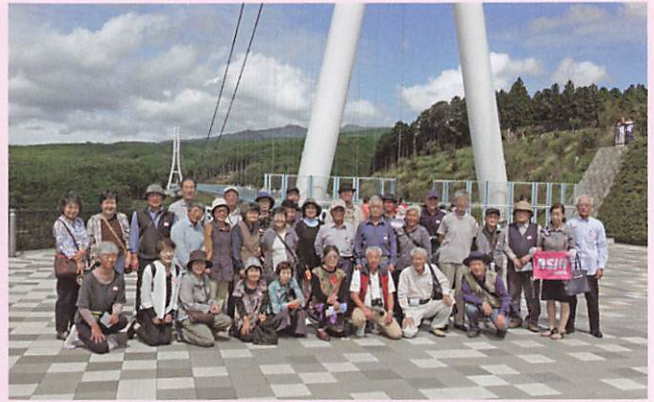
(2019-9-24 共助会旅行 修善寺・江ノ島・横浜)