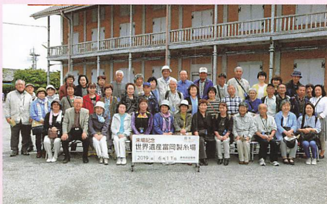
(2019-6-11 共助会旅行 富岡・軽井沢)