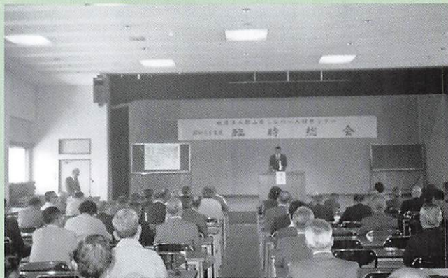
(1981-5-13 臨時総会 郡山市労働福祉会館)