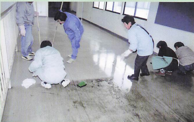
(2002-11-26 ビルクリーニング講習会 本町研修場)