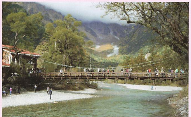
(2016-10-18 共助会旅行 上高地・飛騨高山)