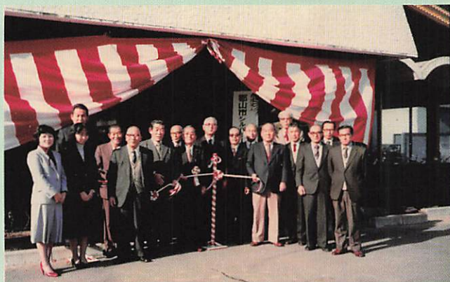
(1980-12-1事務所開き - 朝日1丁目ローズガーデン跡)