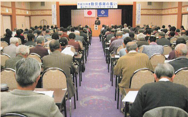
(2008-11-20 勤労感謝の集い 飯坂温泉摺上亭大鳥)