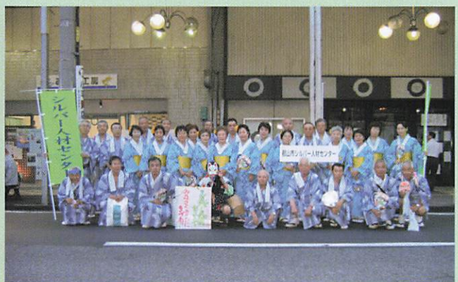
(2005-8-8 うねめ祭り参加会員)