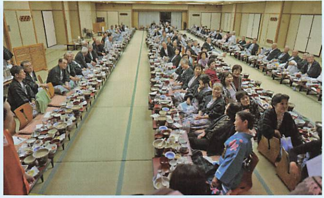
(2013-11-21 勤労感謝の集い 横向温泉マウント磐梯)