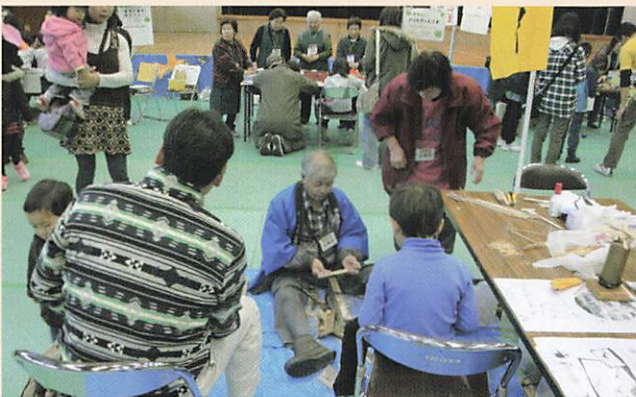
(2010-11-25 子供教室 ビッグバレットふくしま)