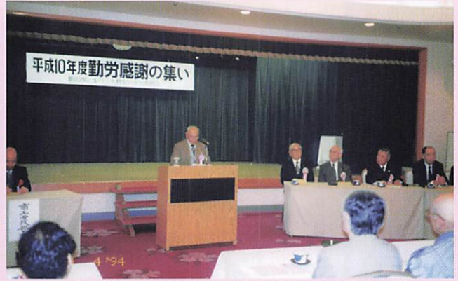
(1998-11-19 勤労感謝の集い 磐梯グランドホテル)