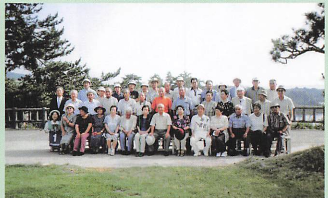
(2004-7-8 共助会旅行 佐渡ヶ島)