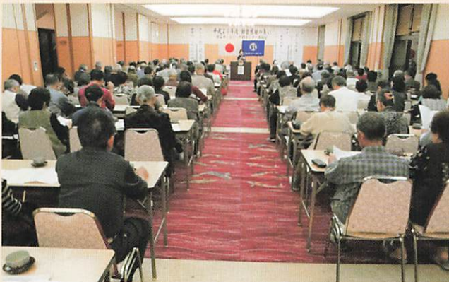
(2009-11-11 勤労感謝の集い 土湯温泉山水荘)