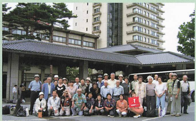
(2005-7-5 共助会旅行 足利・草津 (ホテル桜井))