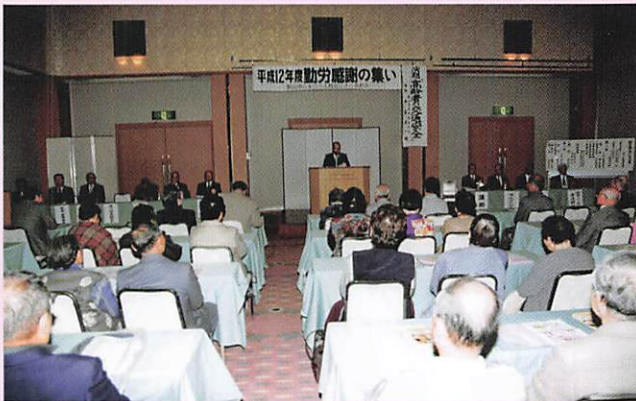
(2000-11-16 勤労感謝の集い 磐梯熱海温泉ホテル華の湯)