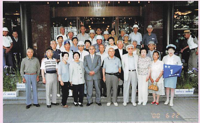
(2000-6-22 共助会旅行 筑波山と潮来)