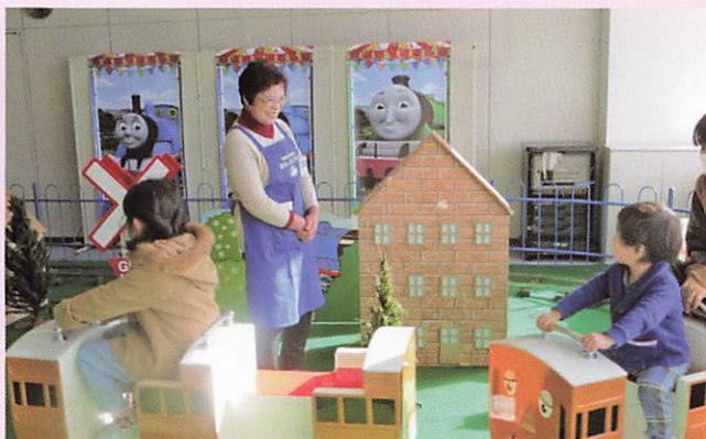
(2018-12-8 イベント係 ビッグアイ)