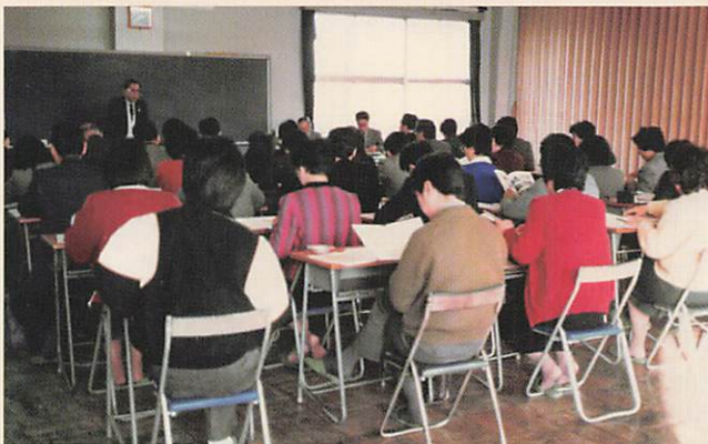
(1988-1-22 県シ協研修会 郡山市SC 長者会場)