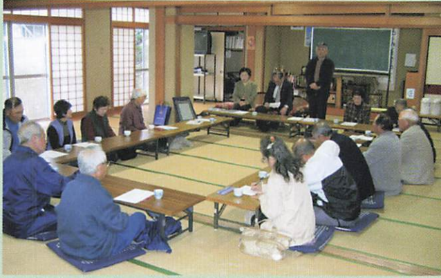
(2005-11-25 地区班会議 中央西1東班)