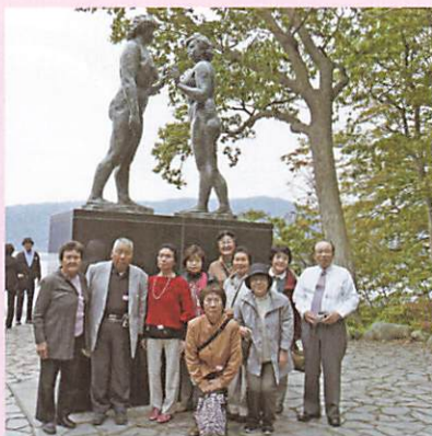
(2018-10-10 共助会旅行 北東北)