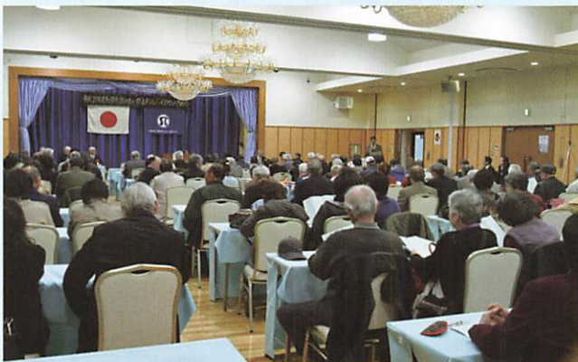
(2015-11-19 勤労感謝の集い 岳温泉光雲閣)