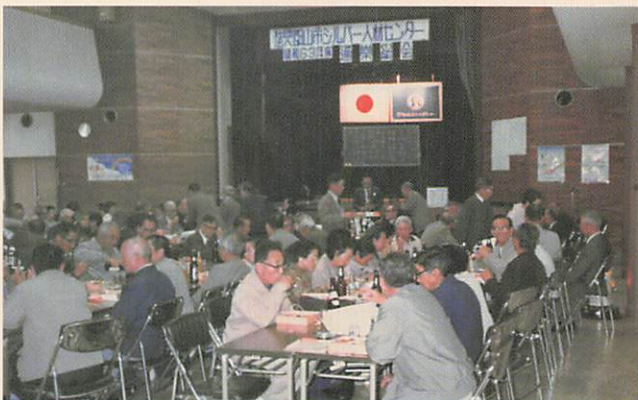
(1988-5-25 通常総会 郡山市公会堂)