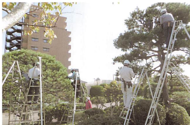
(植木の手入れ講習会)

植木剪定就業会員育成のため、20名の受講参加者が、基礎から応用まで座学と実技の講習を行いました。