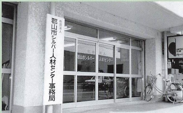
(1981-4-29 細沼町へ 事務所へ移転)