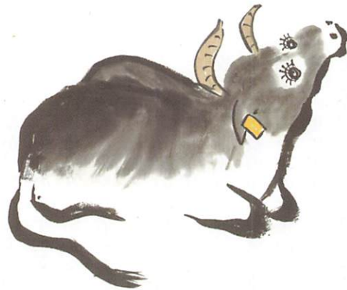
(画：丑干支 山村 光子)