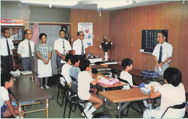
(1985-9-4 小学生学習教室開校)