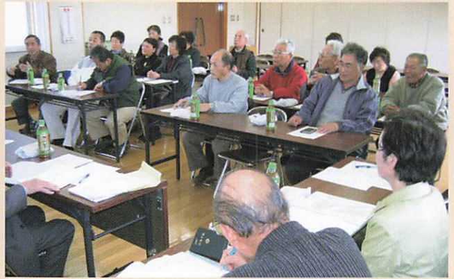
(2007-3-23 地区班会議 東4班)