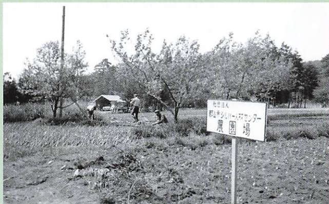
(1982-5-8 シルバー 農園開園)