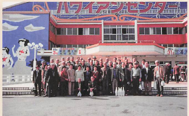
(1987-10-20 会員親睦旅行 いわき-ハワイアンセンター)