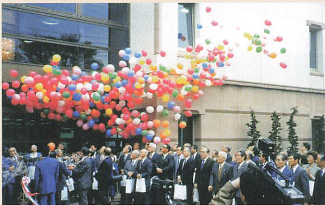
(1990-4 シルバー事務所移転 郡山市総合福祉センター開所式)