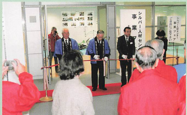
(2004-12-9 シルバー事業フェア開催 ビッグアイ)