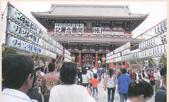
(2008-10-5 共助会旅行 東京・巢鴨・浅草・柴又)