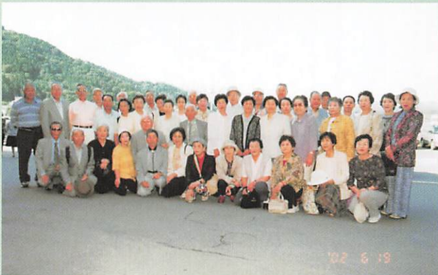
(2002-6-19 共助会旅行 忍野八海・富士河口湖)