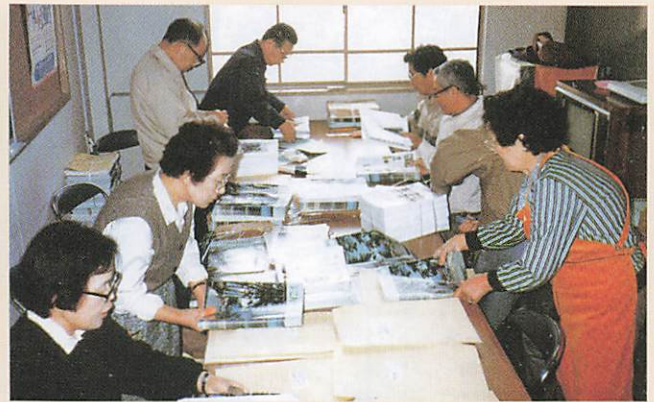
(1988年 広報誌区分け作業)