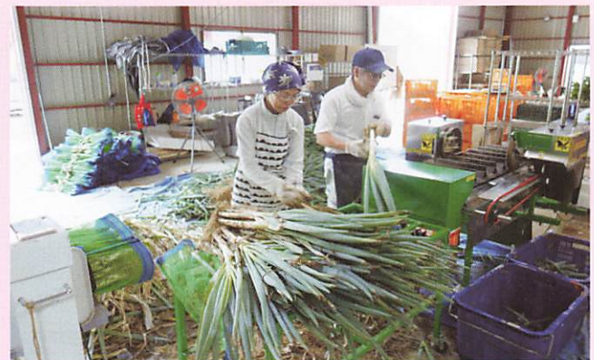
(2018-9-4 農作業 ねぎの選別作業)