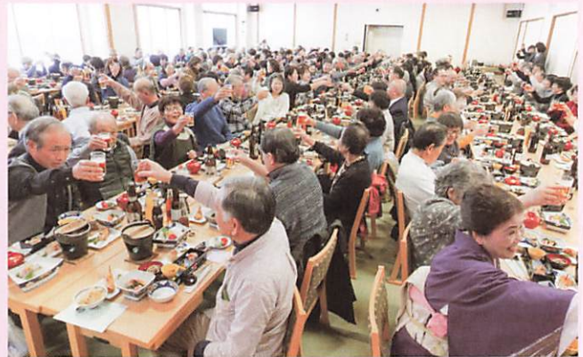
(2020-1-17 会員新年会 月光温泉クアホーム)