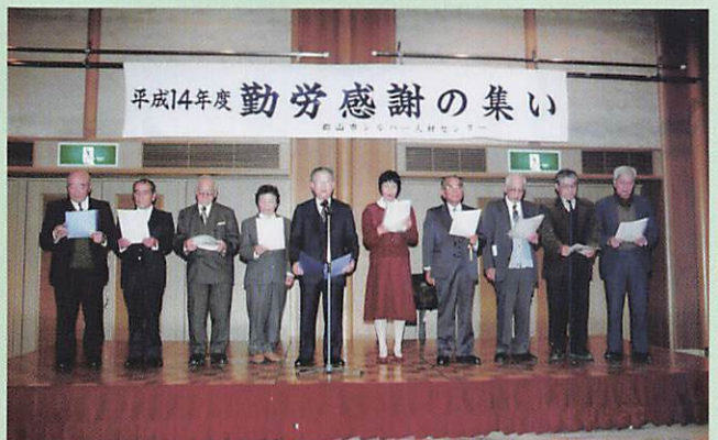
(2002-11-20 勤労感謝の集い 磐梯熱海温泉ホテル華の湯)