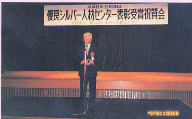
(1997-11-26 全シ協優良シルバー表彰受賞祝賀会 エミナルあさひ)