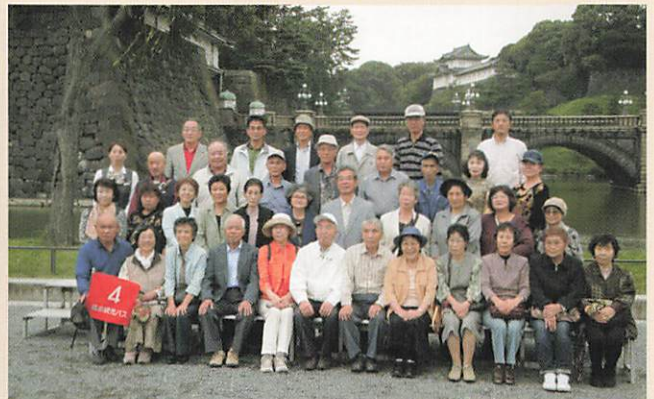
(2009-10-3 共助会旅行 東京築地市場と東京タワー)