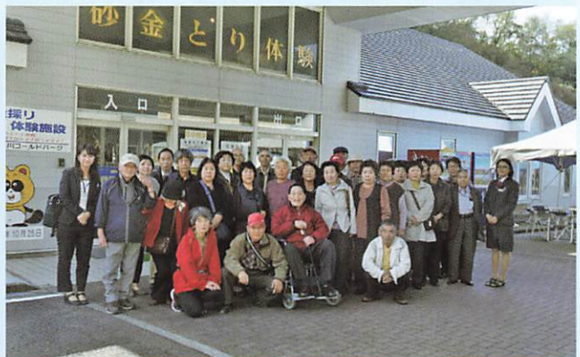
(2015-10-15 共助会旅行 佐渡ヶ島)