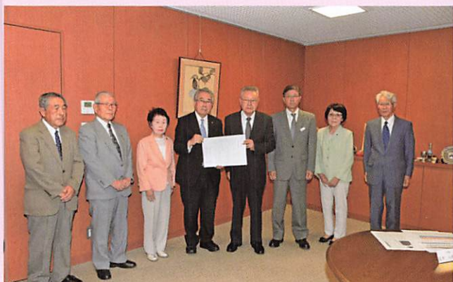
(2019-8-29 要請活動 市長)