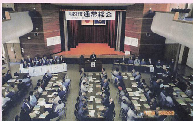
(1997-5-22 通常総会 郡山市公会堂)