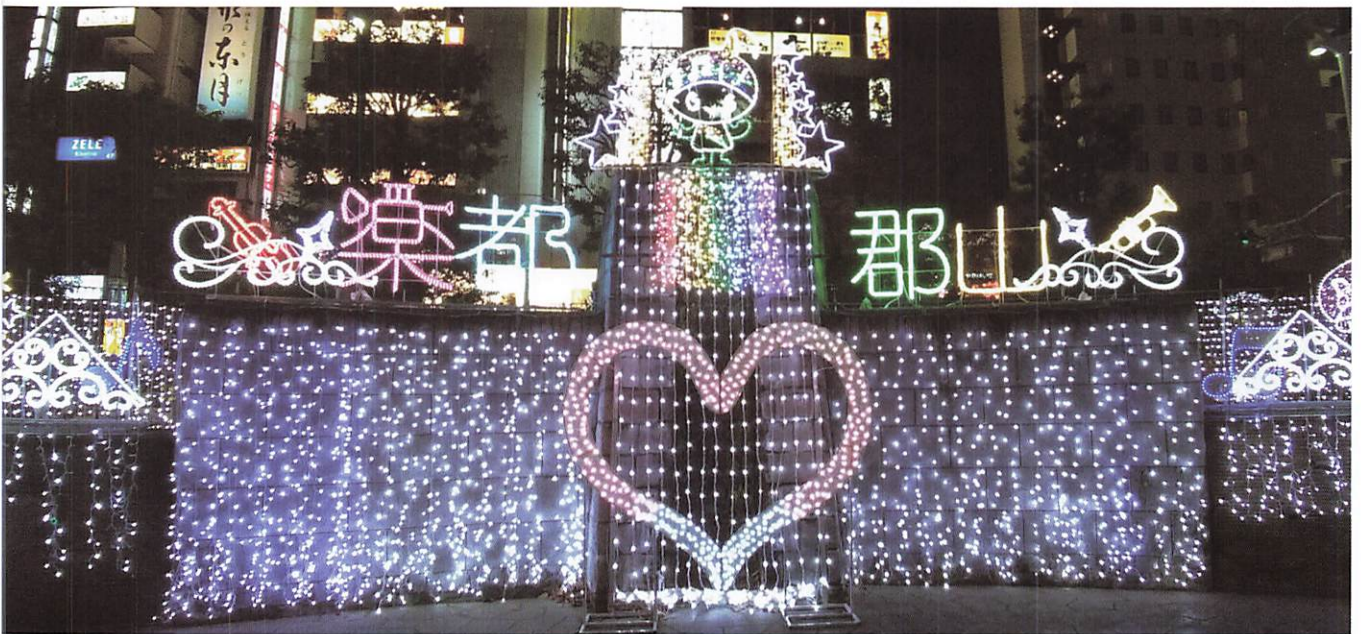
(郡山駅前イルミネーション)