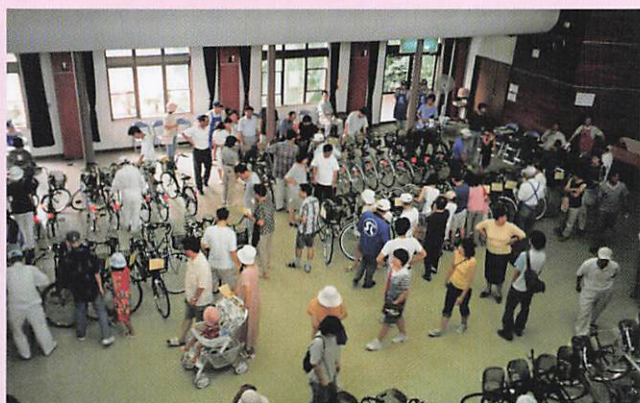
(1996-3-19 リサイクル自転車頒布会 郡山市公会堂)