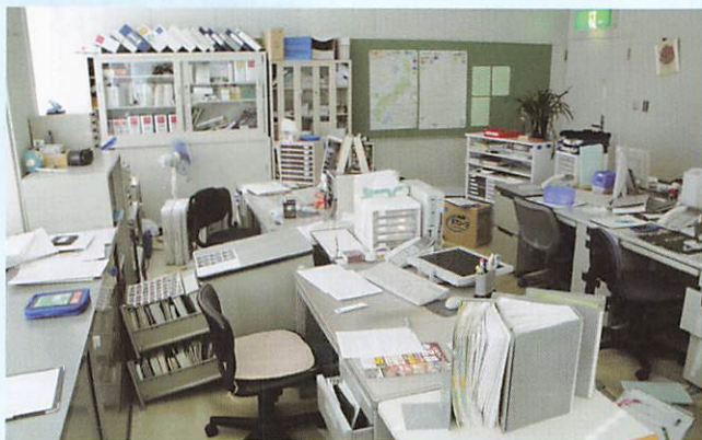
(2011-3-11 東日本大震災被害 事務所)