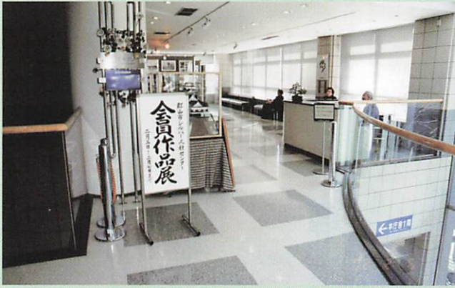
(2002-2-5 会員作品展の開催 郡山市役所2F)