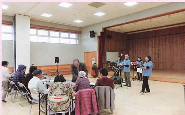
(2019-3-22 地区班会議 富田西地域班)