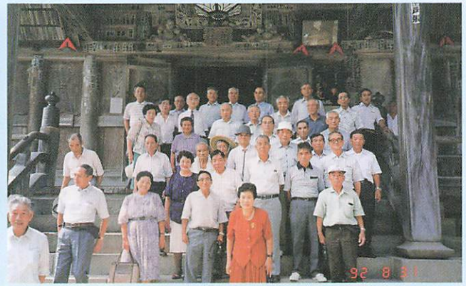
(1992-8-31 会員旅行 会津三観音めぐり)