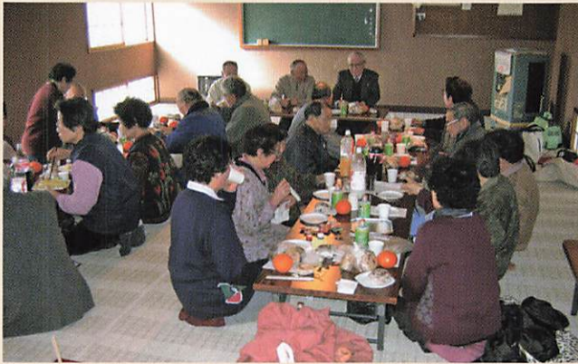
(2007-3-2 地区班会議 東2班)