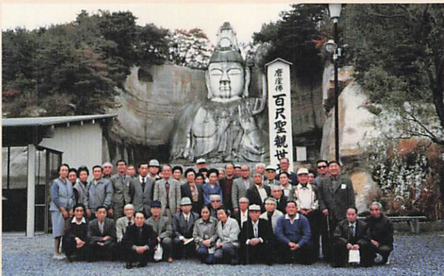
(1986-11-17 会員親睦旅行 百尺観音)