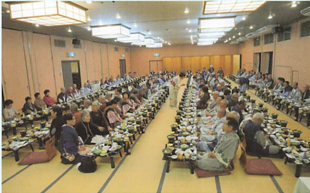
(2014-11-26 勤労感謝の集い 女川温泉華夕美)