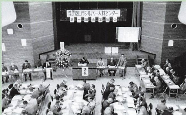
(1981-5-15 第1回通常総会 郡山市公会堂)