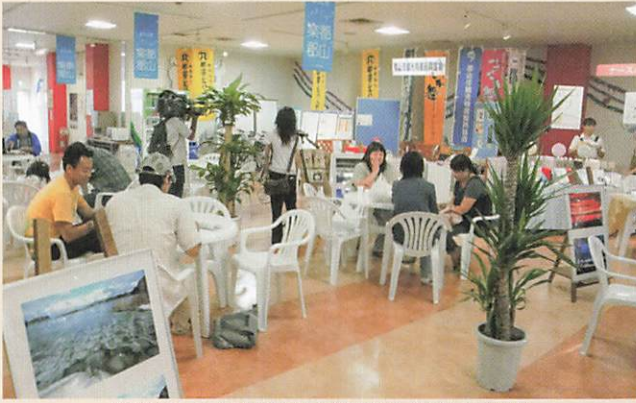
(2009-9-5 町の駅事業参加 郡山市中町)