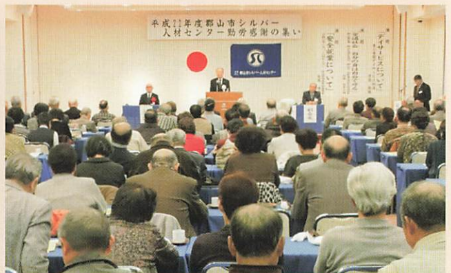
(2010-11-24 勤労感謝の集い 岳温泉あづま館)