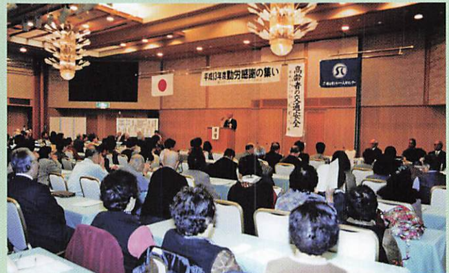
(2001-1-16 勤労感謝の集い 磐梯熱海温泉ホテル華の湯)