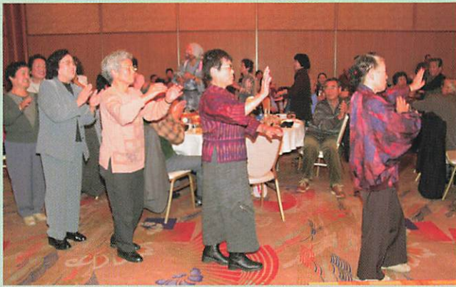
(2004-11-19 勤労感謝の集い 磐梯熱海温泉ホテル華の湯)