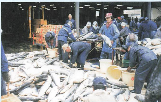
(1993年 新巻鮭塩出し作業)