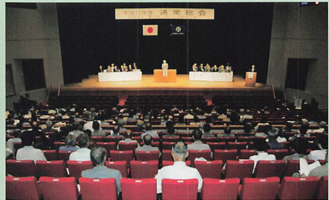
(2001-5-29 通常総会 郡山市民文化センター中ホール)