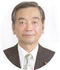
郡山市議会議長 七海 喜久雄