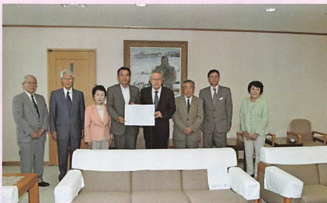
(2019-8-29 要請活動 議長)