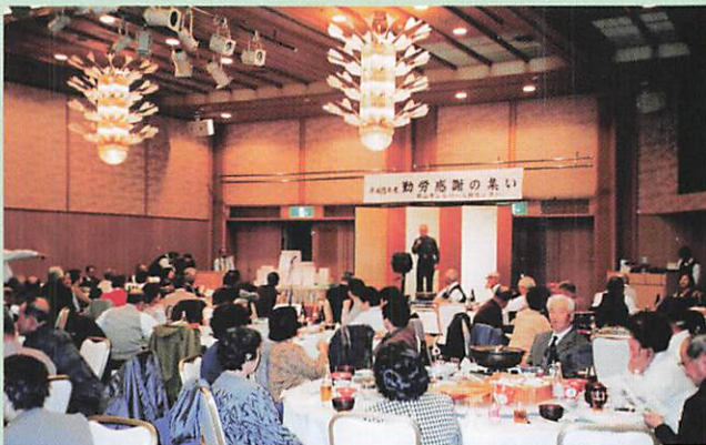
(2003-11-19 勤労感謝の集い 磐梯熱海温泉ホテル華の湯)