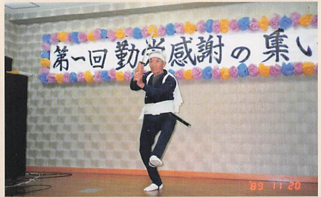
(1989-11-20 勤労感謝の集い 会員演芸披露)