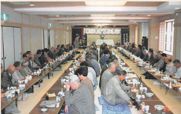
(1989-11-20 第1回勤労感謝の集い開催 磐梯熱海温泉リゾートホテル)