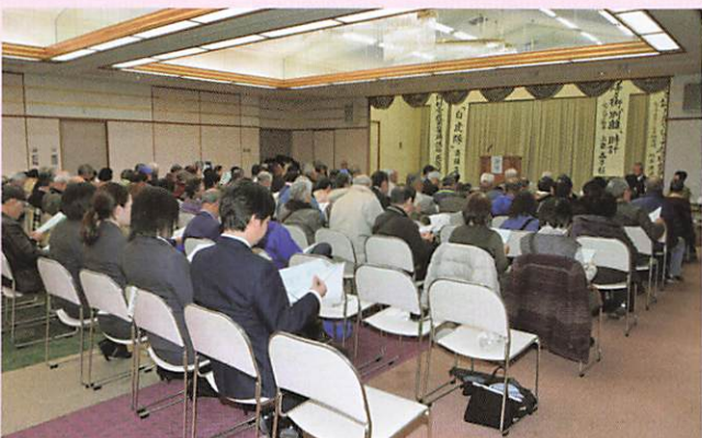
(2017-11-21 勤労感謝の集い 横向温泉マウント磐梯)