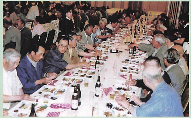
(2003-5-29 通常総会 懇親会 エミナルあさひ)