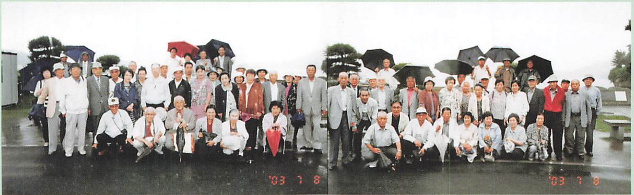
(2003-7-8 共助会旅行 中尊寺・巖美溪・南三陸)