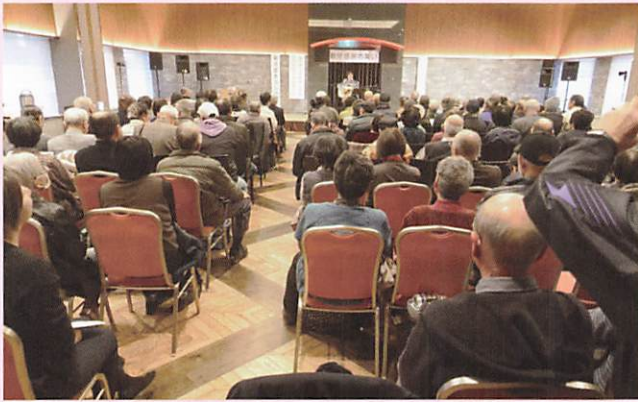
(2019-11-21 勤労感謝の集い 裏磐梯レイクリゾート)