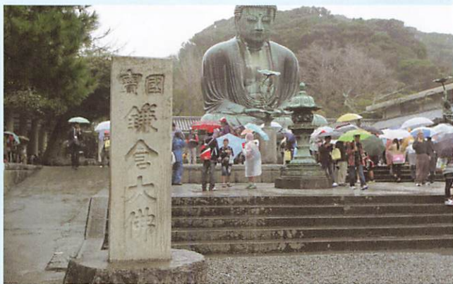
(2012-10-18 共助会旅行 鎌倉)