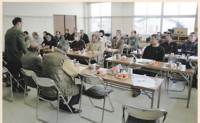
(2010-2-18 地区班会議 安積南班)