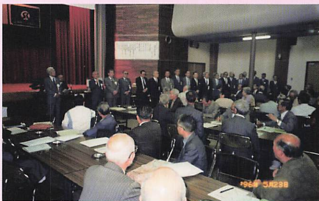
(1996-5-23 通常総会 郡山市公会堂)