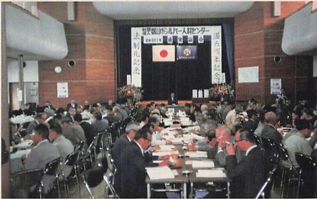
(1986-5-23 通常総会 郡山市公会堂)