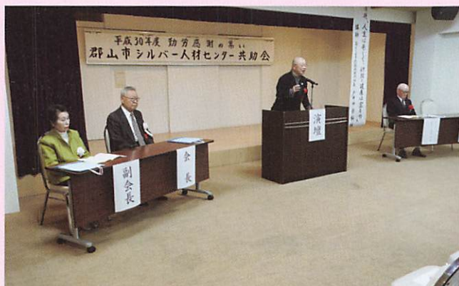
(2018-11-21 勤労感謝の集い 芦ノ牧温泉丸峰観光ホテル)