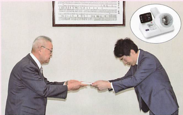
(2020-1-29 血圧計受贈式 丸光産業様より 東邦銀行郡山駅前支店)