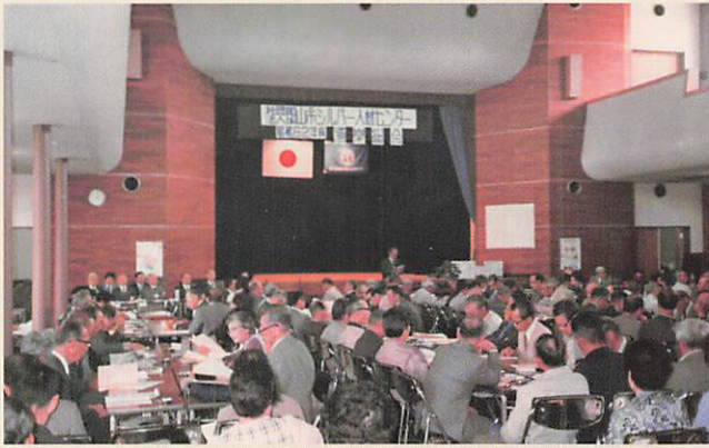
(1987-5-26 通常総会 郡山市公会堂)