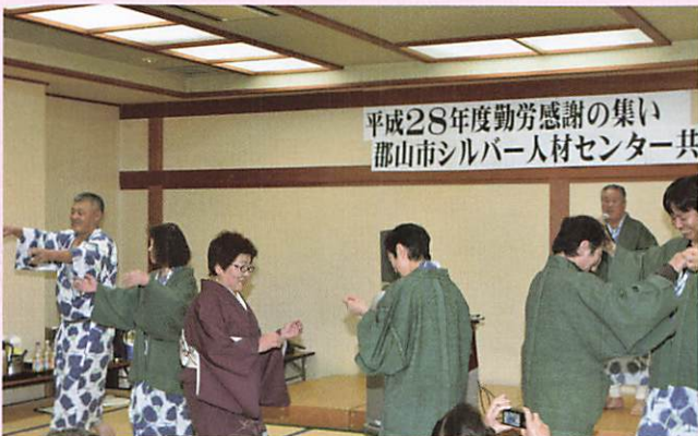
(2016-11-18 勤労感謝の集い 中ノ沢温泉リゾートインぱなり)