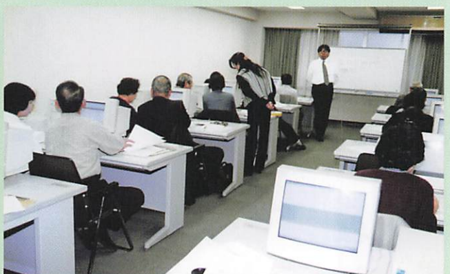
(2002年 パソコン講習会 郡山商工会議所)