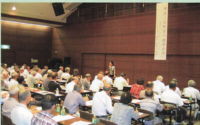
(2005-9-9 健康管理講演会 郡山市総合福祉センター)