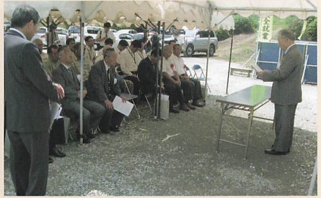
(2009-8-5 残滓堆肥化事業 堆肥作業場開所式)