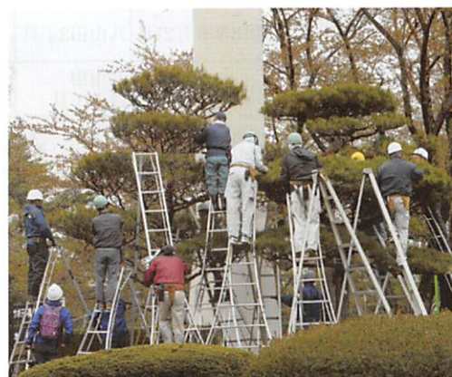
植栽就業者のみなさん