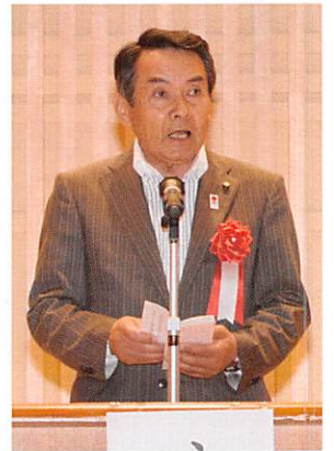
祝辞を述べる郡山市議会議長

わが国の生産年齢人口の減少に伴い、就業機会の拡大を求められているシルバー人材センターの果たす役