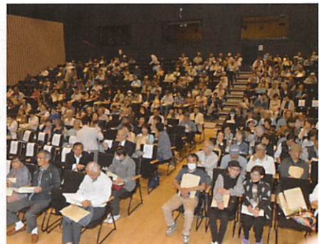
定時総会の様子（2019年5月20日） 於：郡山市立中央公民館多目的ホール