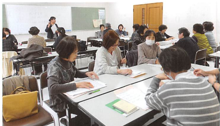
家事援助サービス講習会