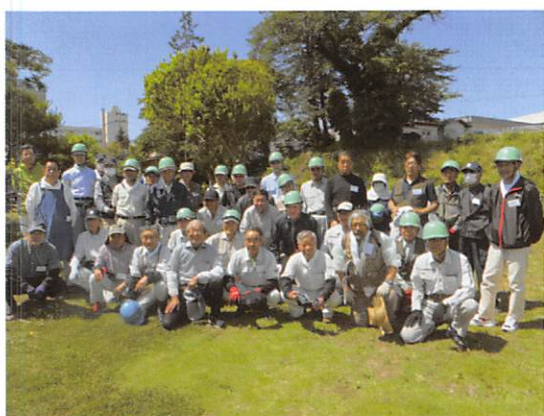
技能を習得中の受講者のみなさん

逢瀬公園緑化センター及び希望ヶ丘ホームを会場に、植木就業希望者を対象にして、会員の技能向上及び就業者拡大を主眼として会員55名が受講しました。