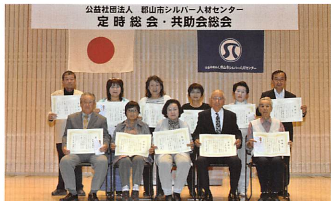
受賞者のみなさん

11名の方々にそれぞれ表彰状と記念品が手渡されました。誠にありがとうございます。これからもますますのご活躍をお願いいたします。