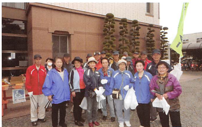
中央東方部のみなさん