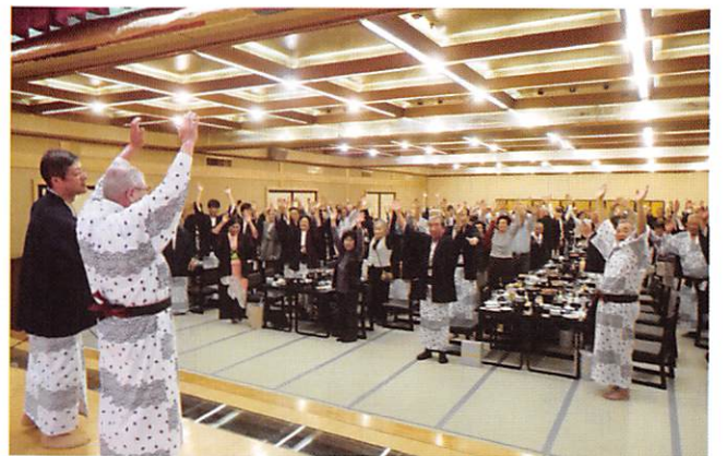
再会を約して万歳三唱

さあ、いよいよ最後はお楽しみ大抽選会、1等、特醸酒2本他、お米からお菓子、さば缶詰め合わせまで外れなし。追加の特賞まであり、もう皆わくわくどきどきです。 私は外れ、ティッシュ5個組みです。風邪引きに役立ちそう。 宴会終了後はみなさん銘々に、またお風呂に浸かったり、夜中までお喋りしたとか。私はぐっすり就寝して、朝もお風呂に浸かり、バイキングの朝食も、団体ながらなかなか美味しかったのでたっぷり食べてしまいました。 次の日からのダイエットを心に決め、帰りのバスに乗る。バスは会津