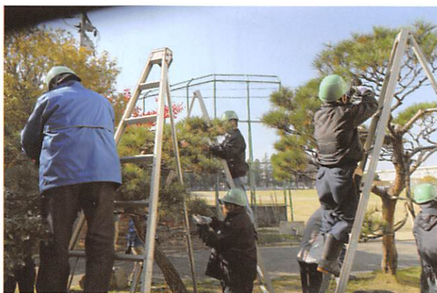
植木手入れ講習会

植木手入れ就業者不足に対処するため、29名の会員が参加して育成を第一に講習を行いました。