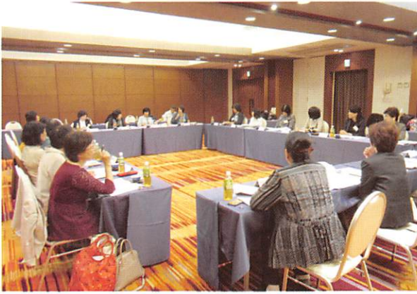
女性代表理事研修会

て研修会が開催されました。 講演「我が社における高齢者の現 状と今後の取り組みについて」 講演「第2次会員100万人 達成計画について」 分科会、全体会 全シ協主催 女性代表理事・常勤理 事・事務局長経験者研修会