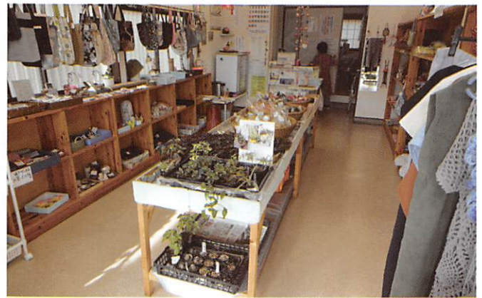
憩いの広場：店内の様子