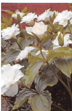
八重咲エンレイ草

花が大きくなったので、植え替えたりとお世話をしていました。ところが今年の春、ちょうど桜の花が終る頃、今年は何と、と庭においた鉢を見たら、ない！！もうガッカリです。私の思い出を（宝物）かえして下さい！！どっかできびしがっています。私のもっとさびしいです。