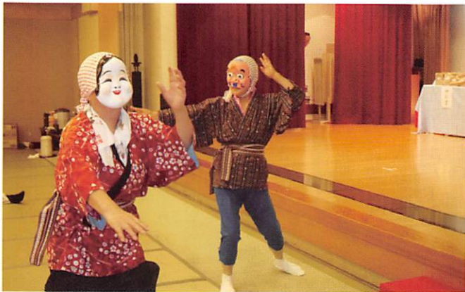
熱演、ひょっとこ踊り