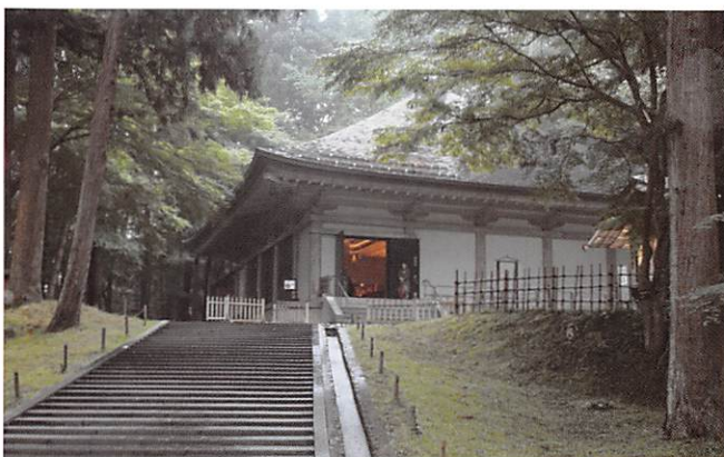
平泉中尊寺金色堂

これからが夜は私の出番、とばかりに、芸達者な皆さんの歌声と北の魚を肴に一杯飲んで、舌鼓。 アーたまらないなあー、などご満悦。 次の日になり、天気ははつきりしないけれども旅は弘前城へ 天守閣まで辿り着けなかったけれど、それはそれ。