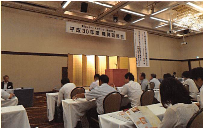
東北シ協職員研修会

8月23日、24の2日間、秋田市において開催されました交流研修会に東北地方から95人が一同に参加し