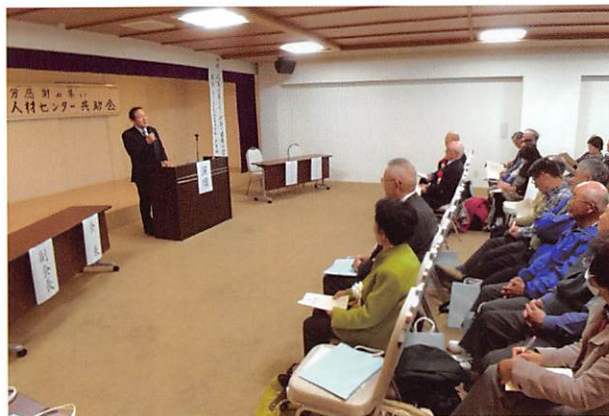
講演会「人生は楽しく」

ホテルの中の豪華ホテル。これは行かない手は無いななどと、即参加申込み。お昼過ぎにバス3台による送迎があり、バスは磐越道を西へ進む。2時間ほどで会場に到着。