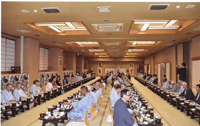
交流会、宴会の様子