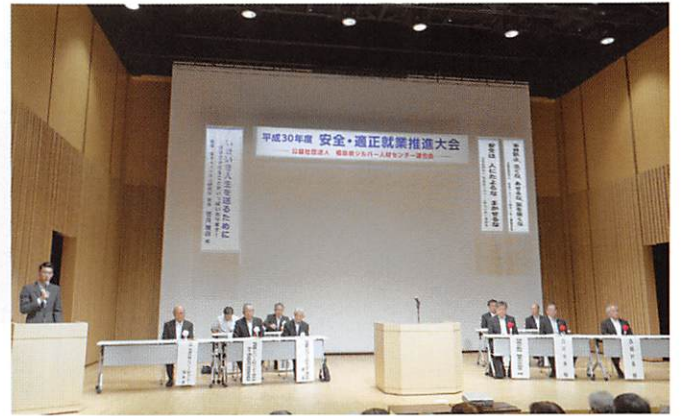
県シ連：安全・適正就業推進大会