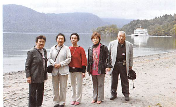
十和田湖畔で記念撮影

今年の共助会一泊の旅は、春に引 き続き東北、それも青森・秋田・岩 手方面とずいぶん欲張りな旅でした。 長い人生を生きてきて、その内行 こうと、ずーっと思っていた十和田・ 奥入瀬。今回の共助会旅行で思いが けずにその思いが叶うこととなりま した。