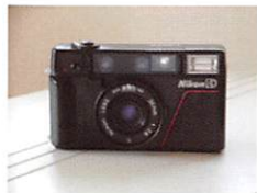
ニコンカメラ（カリブ）