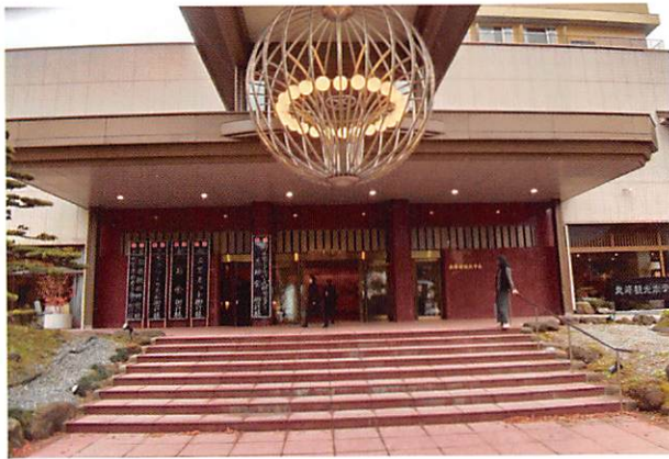
丸峰観光ホテル玄関

今年の勤労感謝の集い、会津芦ノ牧は、黒糖饅頭のCMがテレビで流れる「丸峰観光ホテル」での開催でした。