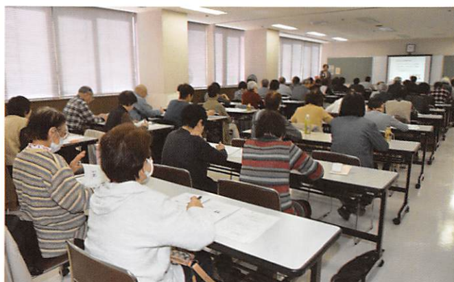
県シ連：派遣講習会