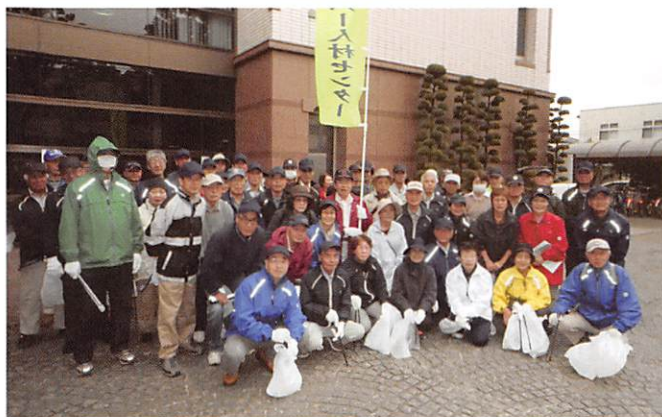
中央西方部のみなさん