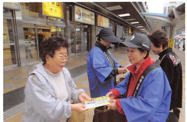
郡山駅前会員募集活動