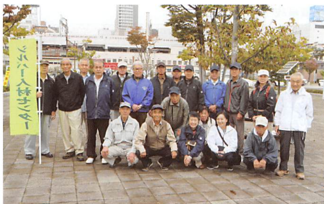
東方部のみなさん