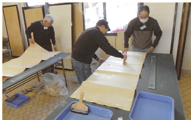
襖・障子張替え講習会