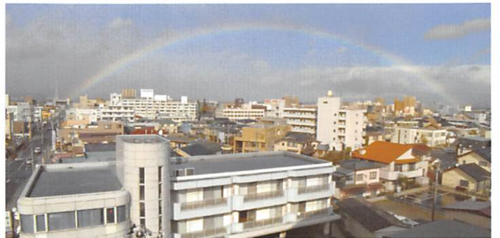
センターに懸かる虹