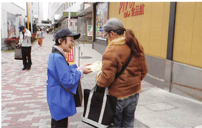
郡山西口駅前街頭PR活動の様子