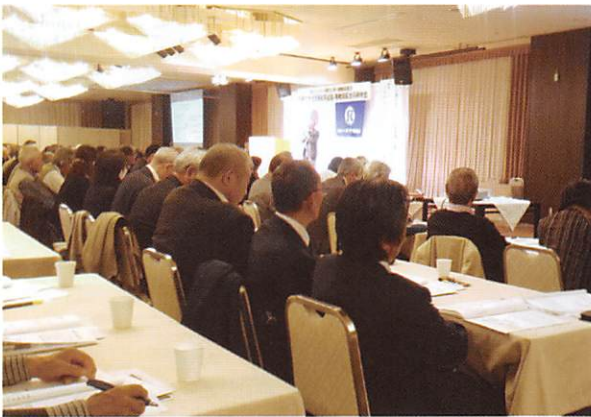
東北シ協役員等研修会

平成30年9月27日、28日の2日、 全国から女性リーダー等30名が一同 に会し今後のシルバー事業における 女性の重要な役割について研修意見 交換しました。 講演「これからのシルバー人材セ ンター事業く女性リーダー