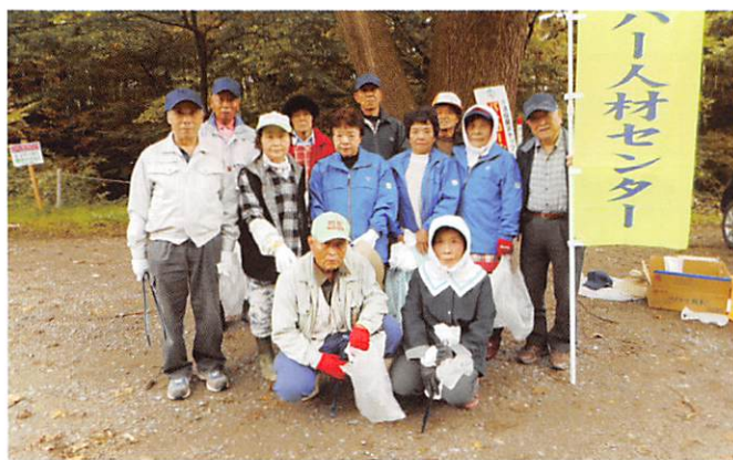
東方部-中田のみなさん