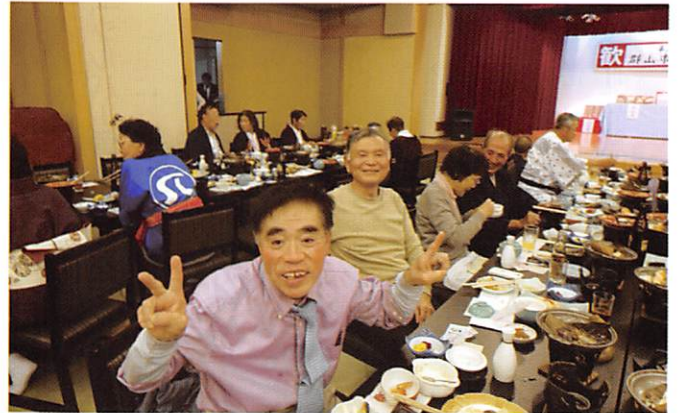
盛り上がる交流会

さあ、いよいよ最後はお楽しみ大抽選会、1等、特醸酒2本他、お米からお菓子、さば缶詰め合わせまで外れなし。追加の特賞まであり、もう皆わくわくどきどきです。 私は外れ、ティッシュ5個組みです。風邪引きに役立ちそう。 宴会終了後はみなさん銘々に、またお風呂に浸かったり、夜中までお喋りしたとか。私はぐっすり就寝して、朝もお風呂に浸かり、バイキングの朝食も、団体ながらなかなか美味しかったのでたっぷり食べてしまいました。 次の日からのダイエットを心に決め、帰りのバスに乗る。バスは会津