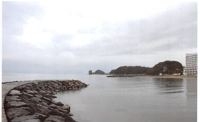
宿から望む陸奥湾

ねぶた村で津軽三味線の実演に聴き惚れたあと、バスは少し遅れて高速道路を鹿角へ。ここで昼食、山菜おこわが美味。美味しかったとみなさんが言うので納得。またまたお腹いっぱいになり、バスは雨の中を八幡平アスピーテラインを上る。せっかく来たのだからと雨でもバスは上る。