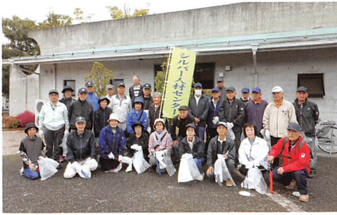
南方部のみなさん