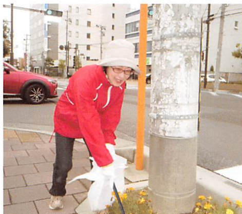
街路清掃ボランティアのひとこま