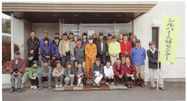
北方部のみなさん