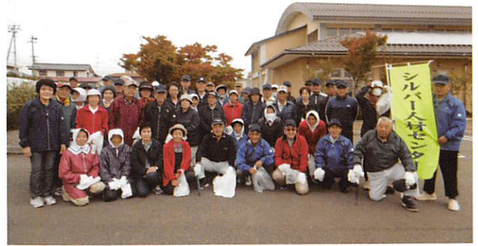
西方部のみなさん

役・職員、事業委員会委員18名により、郡山駅前西口・東口において街頭PR活動を行いました。 チラシ、ポケットティッシュ、花の種をセットにして、道行く市民の方々に手渡ししながら、シルバー事業の説明、会員募集、仕事の発注などを勧めてPRしました。