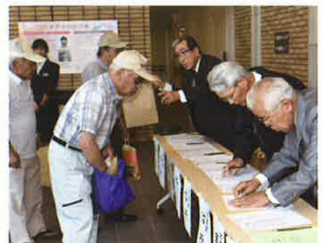
定時総会の様子（平成29年5月30日）於：郡山市中央公民館多目的ホール