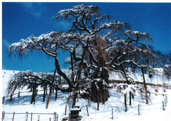
寒さに耐える滝桜