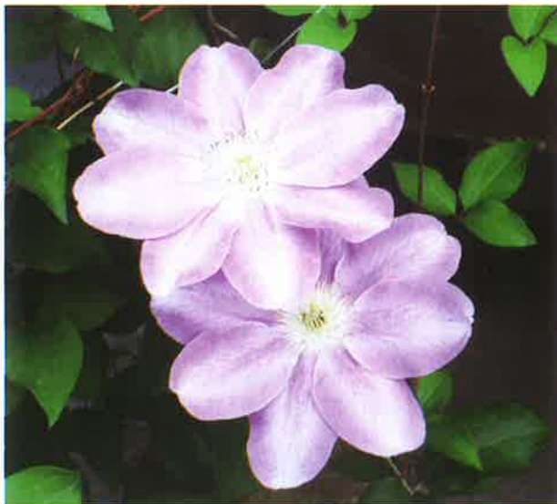
夏を彩るクレマチス

(公社) 郡山市シルバー人材センター 〒963-8024郡山市朝日一丁目29番9号 TEL (024) 933-0001 FAX (024) 933-0019 URL http://www.k-sjc.org