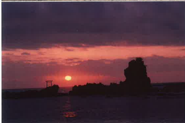
波立ち海岸の日の出