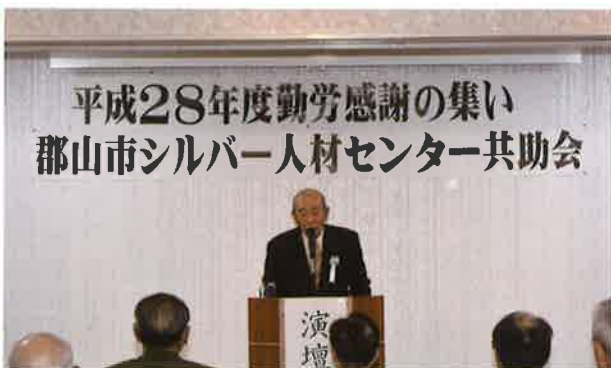
平成28年度勤労感謝の集い 郡山市シルバー人材センター共助会