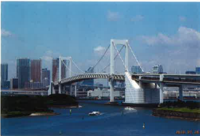
レインボーブリッジ