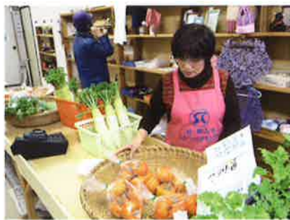
「憩いの広場」 楽しく気軽にに入れる店

人との出合いを大切に、皆様の暖かいご支援を受けながら、日々成長して行きたいと思っております。