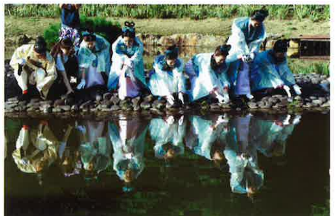
うねめ祭り、亀の放生 (片平町うねめ公園)