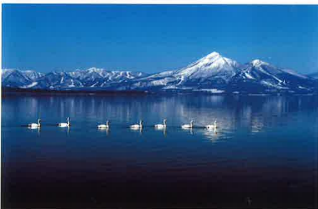
磐梯山と白鳥 (湖南町福良浜)