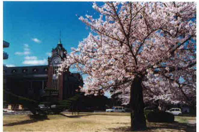
郡山市公会堂に咲く桜