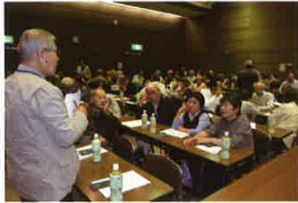
植木・除草就業者研修会