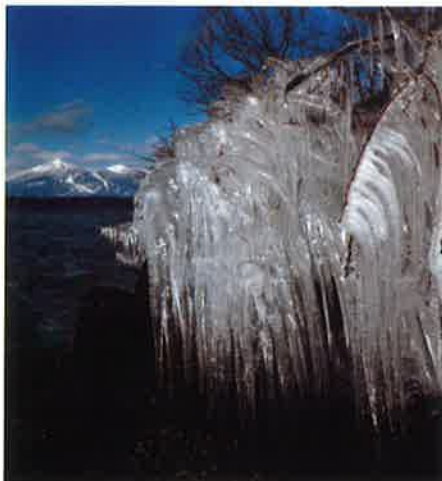
磐梯山とシブキ氷 (湖南町浜路)