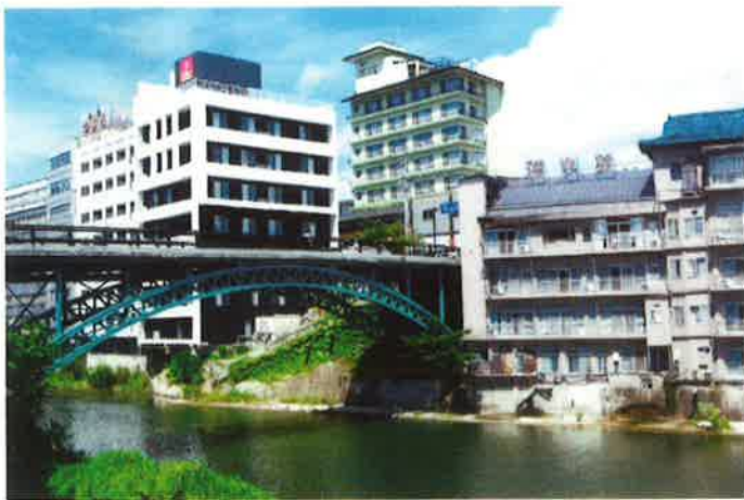
飯坂温泉街より十綱橋を望む

場に沿って建つ5軒の旅館があり、近年は国内外の貴賓を接待出来る宿として、有名な一軒が吉川屋旅館です。 川向い眼前の絶壁（岸壁）の高さは60〜70メートルあるかと思う。その景観に見惚れる。 また、摺上川ダム（茂庭っ湖）は、工事に利用した土地を自然の森に再生する「森づくり大作戦」に基づいて、35年の歳月を費やし、平成18年9月に竣工した。