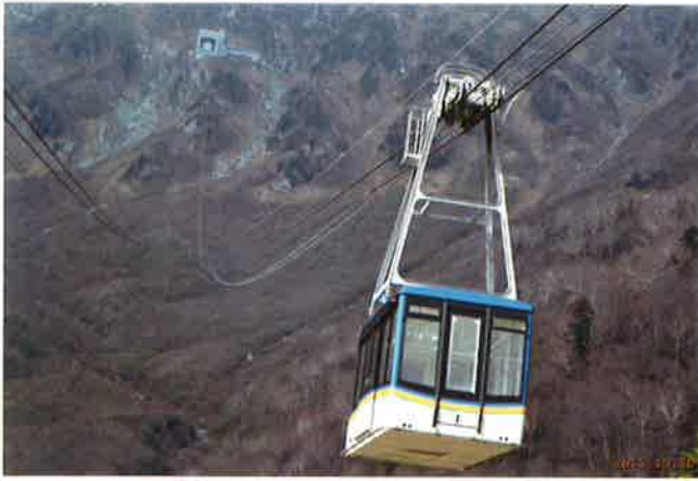
黒部平ロープウェイ