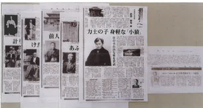
福島民友新聞掲載