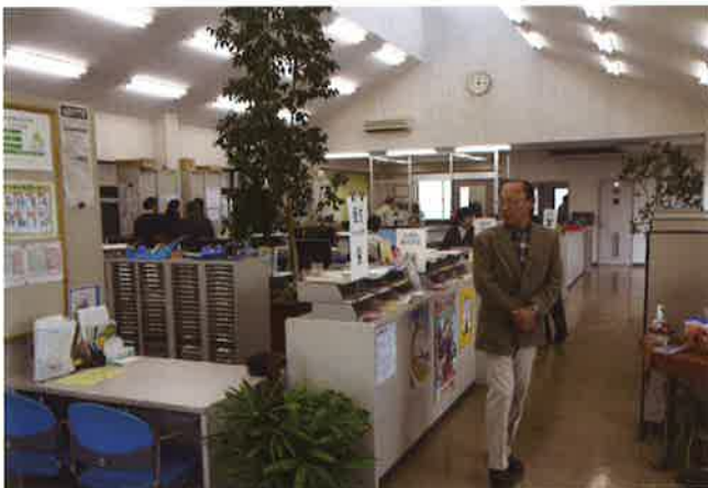
新座市 S.C. 事務所内

どを、会員が中心となって、企画・立案、推進と、会員自らが中心となって運営している事であり、更には多種多様な親睦会活動があり、会員の福利厚生や生きがい創生を図っている様子には驚くばかりでした。 当 S.C. 役職員一同、今回の研修を手本として、全てに積極的な組織運営活動を行っていきたくと強く念じて新座市 S.C. を後にしました。