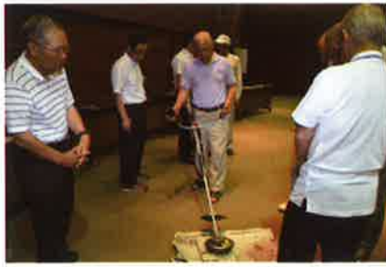
刈払機取扱い講習会

今後もくり返し講習会を開催して参りますので、皆さま是非受講なさるようご案内いたします